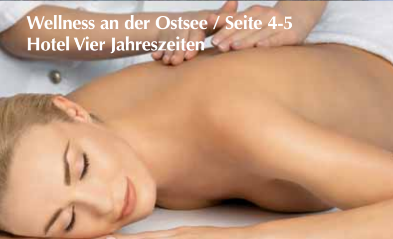
Wellness an der Ostsee / Seite 4-5 Hotel Vier Jahreszeiten