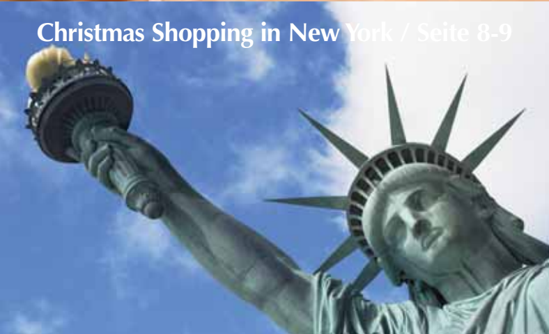
Christmas Shopping in New York / Seite 8-9