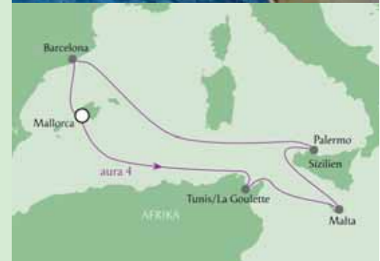
powered by FERIEEN