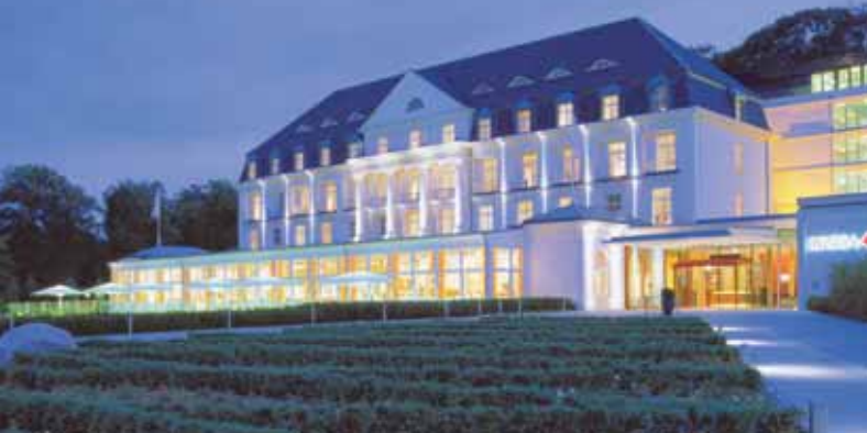
A-ROSA Resorts / Seite 2