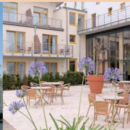
Hotel Vier Jahreszeiten Binz ****+