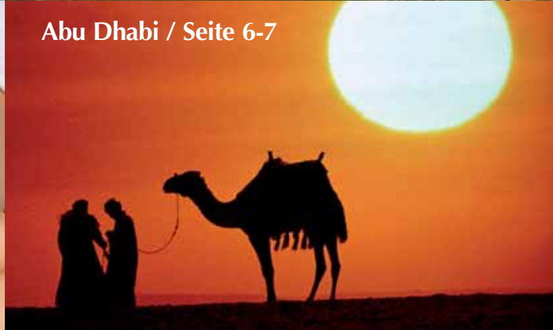
Abu Dhabi / Seite 6-7