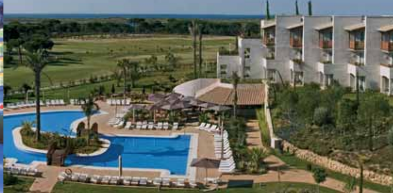
Hotel El Rompido Golf***** / Seite 3